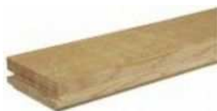
Tölgy Csaphornycs parketta

FIGYELEM! A csaphornycs parketták teljes egészében valódi fából készűlnék, amely egy természetben fejlődő natúrtermék. Strukturális és színváltozások az anyag tulajdonságai, melyek megjelenési formái rendkívűl változatosak. A bemutatott fotók ezéert nem reprezentálhatják teljes valóságában az egész felületet, arról csak általánosságban szolgálnak információként.