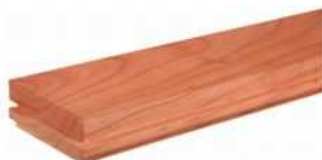
Cseresznye Csaphornyos parketta

Rusztik: Rajzolatossá, álgesztet is tartalmazó, színes, tarka anyag. Göcsöket 15 mm átmérőig megengedettek.