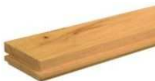
Akác Csaphornyos parketta

Egységes: A fafajra jellemző összes jellemzővel. Szíjács, nagyobb színeltérés, göcsök 15 mm átmérőig megengedettek.