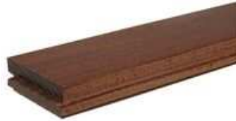
Gőzölt akác Csaphornyos parketta