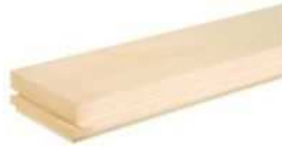
Juhar Csaphornyos parketta

Egységes: A fafajra jellemző összes jellemzővel. Szíjács, nagyobb színeltérés, göcsök 15 mm átmérőig megengedettek.