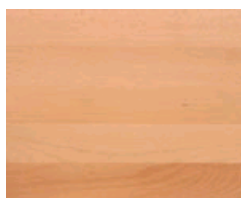
Gőzölt bükk natúr