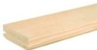
Kőris Csaphornyos parketta

Rusztik: Göcsök, álgeszt, erős színeltérésű elemek jellemzik ezt a minőséget. Színes, markáns minőség, melyben a göcsök átmérője 15 mm-ig megengedett.