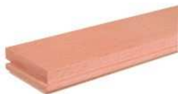
Gőzölt bükk Csaphornyos parketta