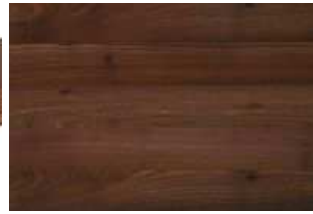
Gőzölt akác egységes